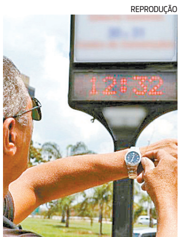
Não haverá horário de verão

O Ministério de Minas e Energia informou que o governo não vai retomar o horário de verão neste ano. A pasta justificou a falta de tempo hábil para não voltar